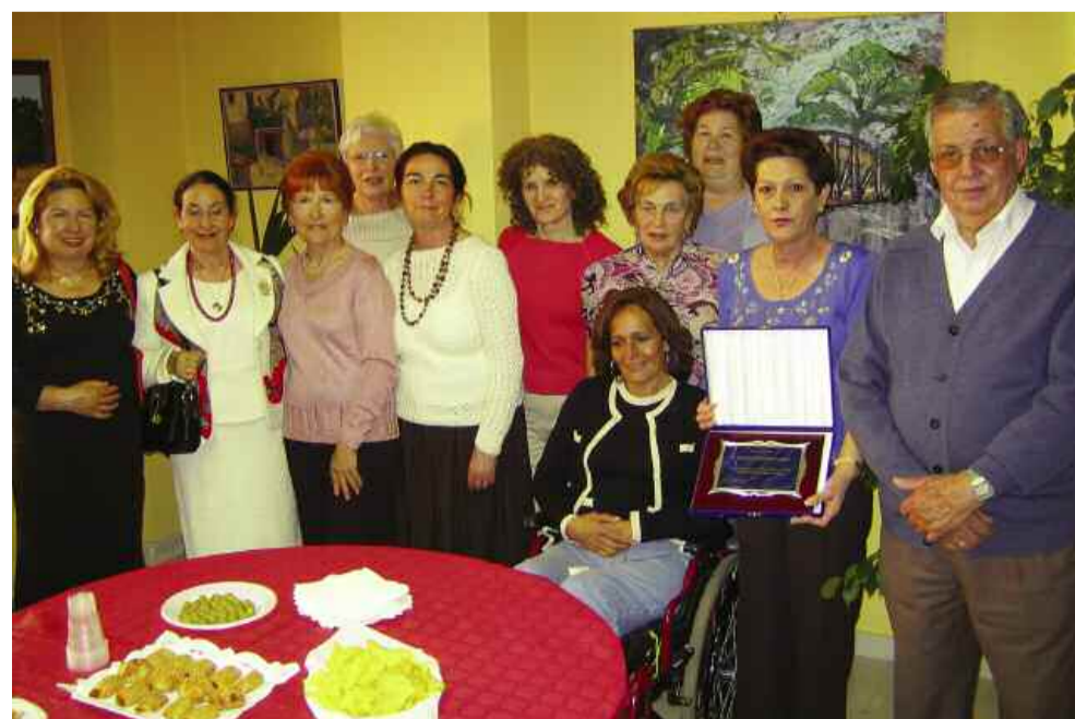
Componentes de la Asociación con la placa recibida

La pasada Navidad se cerró un ciclo de 12 años, y las componentes de la Asociación Mercadillo Solidario de El Bosque se ha ganado el reconocimiento de todos a la altruista labor. Con el Mercadillo, cada Navidad, nos han hecho disfrutar a todos los vecinos, no solo de El Bosque, también a los muchos que venían del pueblo y de otras localidades, siendo importante referencia para otros que lo tomaban como ejemplo.