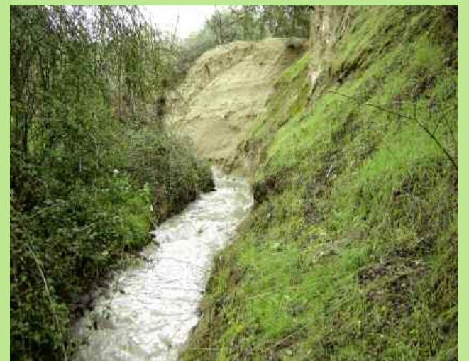
Paredes verticales le rodean.

rior del tronco hueco. Del mismo modo, sus maderas medio carcomidas son un buen almacén de agua.