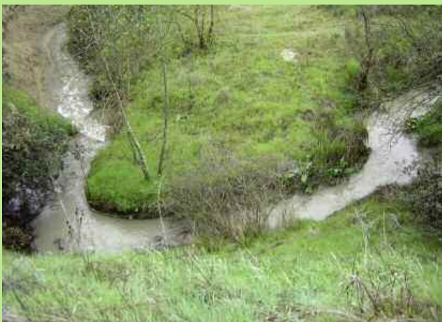
Impresionantes meandros al lado de nuestras casas.

El lecho del arroyo es un lugar idóneo para descubrir y aprender a reconocer huellas de animales. Las más frecuentes son de patos y pollas de agua, entre las aves, y de conejos y ratones de campo.