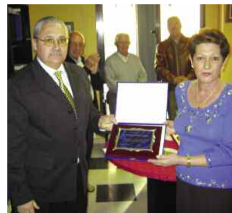
El presidente hace entrega de la placa

Enhorabuena a las que se van y nuestro mejor deseo y todo nuestro apoyo a los que, con ilusión toman el relevo.