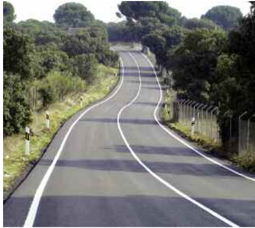
Cuneta de la carretera del mosquito antes de la obra.

Esperamos que tomen interés por resolver lo que puede llegar a ser grave.