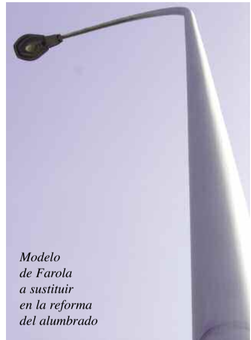
Modelo de Farola a sustituir en la reforma del alumbrado

Al respecto, y cara a que se ejecute con la mayor brevedad posible, le solicitamos el que en el menor plazo nos reunamos para este único y concreto tema, a los efectos de definir lugar de actuación y criterios de coordinación para la efectiva ejecución de la obra.