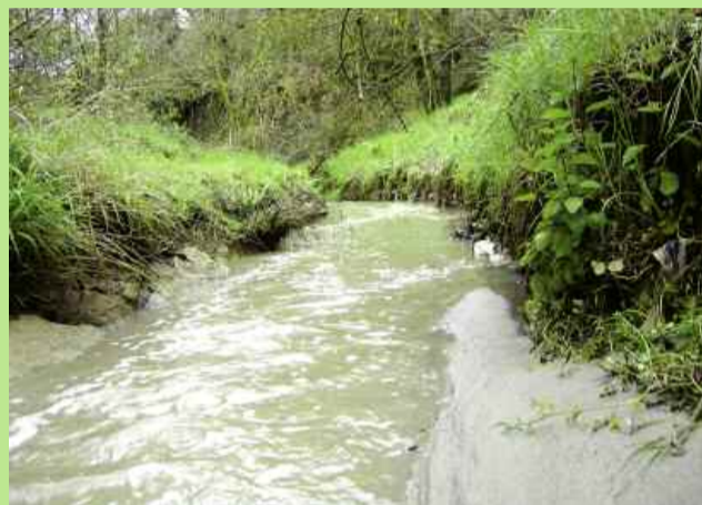
Playitas de fina arena a sus orillas.

Encontraremos también varios tipos de cardos, pero los más comunes son el cardillo, el cardo de cardar, y el famoso cardo borriquero.