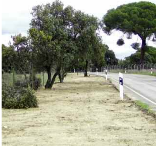
Cuneta carretera del mosquito actualmente.

Tras podar la Entidad los árboles de la cuneta de dicha carretera, allanamos, con nuestros medios, dicha cuneta para convertirla en una zona por la que pudieran transitar las personas que van andando por esa vía, y que cada vez son más debido al funcionamiento del tren ligero, dado que el presupuesto de construcción de carril bici ó acera era inabordable por la Entidad y el Ayuntamiento no tiene presupuesto. Aún así seguiremos trabajando con el municipio para llegar a asentar lo que bien podría ser un camino de zorra que impida que se haga barro cada vez que llueve y sea cómodo al caminar.